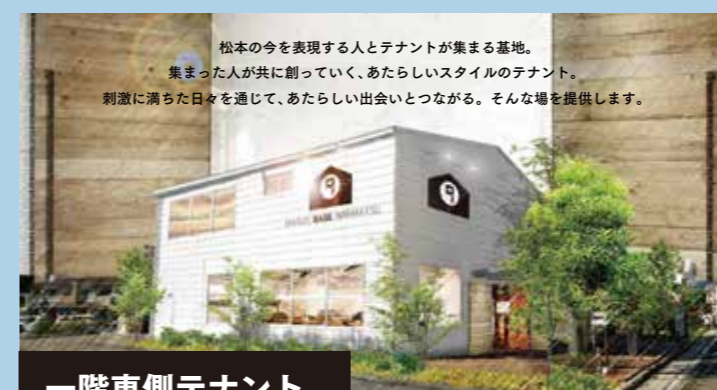
一階東側テナント