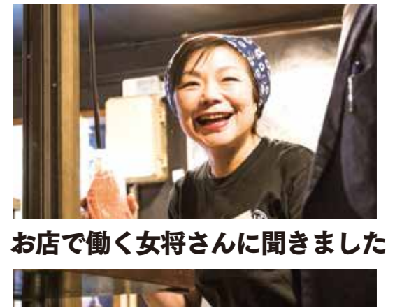
お店で働く女将さんに聞きました！

今後、こんなことをしたい これまで、松本では「城下町酒の宴」等のイベントを中心となり開催してきました。これは、松本駅前の飲食店が協力して信州各地30蔵の地酒を集結し、1店舗1蔵ずつの飲み歩きができるというもの。信州の食文化を紹介する、信州の日本酒を楽しむことを目的に行っているイベントで、観光客の方々や地域の皆様にも広く楽しんでいただいております。今後もぜひ、皆様の力を借りながら、地産地消・食の安心安全・地域の食文化・酒文化の継承にこだわり、信州の食文化を広く、多くの方々に紹介していきたいと思っています。