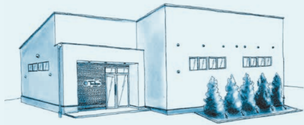
「今回デザインさせていただいたお店」