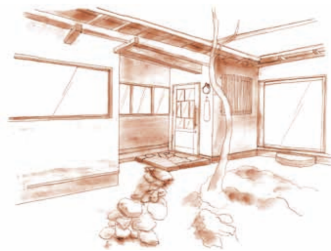
「今回デザインさせていただいたお店」