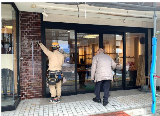
[工事種別] 電気工事 [作業内容] 既存照明、配線撤去