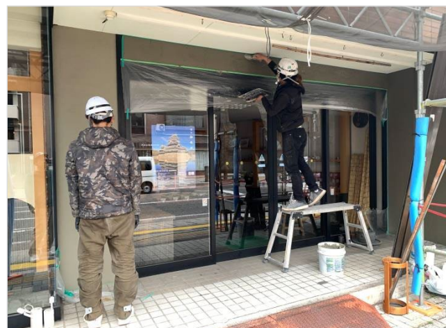
[工事種別] 左官工事 [作業内容] 壁面下地処理