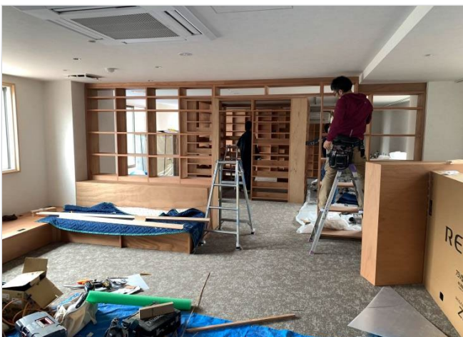
[工事種別] 家具工事 [作業内容] 2F 家具設置