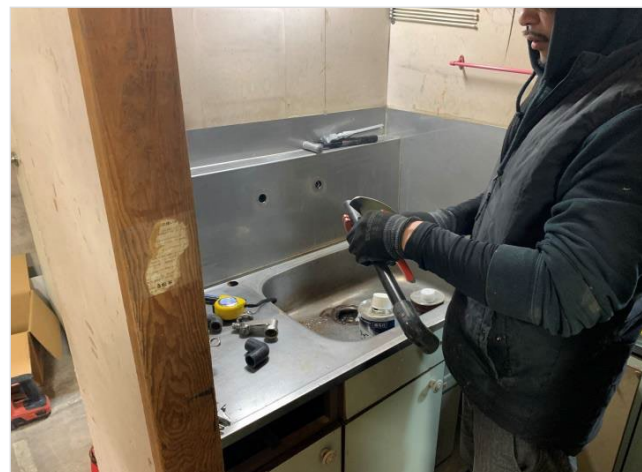
[工事種別] 給排水設備工事 [作業内容] 堤治様 新規配管