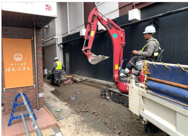
[工事種別] 外構工事 [作業内容] 通路 路盤固め