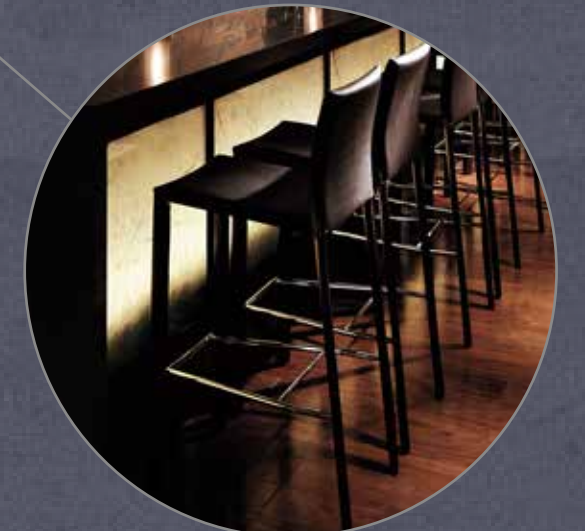
クレス ロレスカウンター B