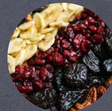
特産ドライフルーツ