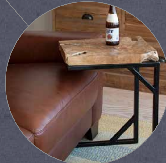
サイドテーブルイメージ