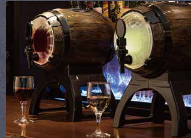
樽型ワインサーバー

セルフバーは飲み放題制で、ホテル宿泊予約時にセットプランとして予約します。フードもセット内に含み、ほとんどをお客様のセルフサービスとして機能します。