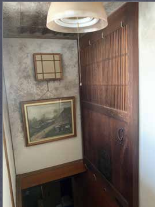
正面入り口に蔵戸を設置し、印象に残るファサードに。