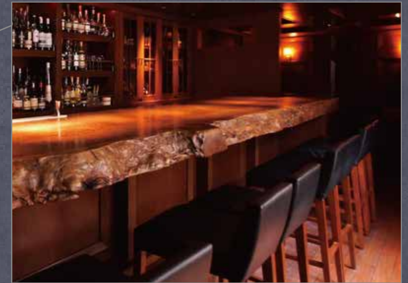
イチイの木を使った迫力あるカウンターテーブル。