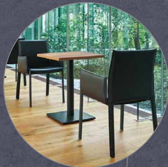
クレス ロレス WB