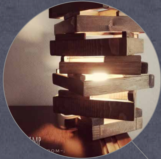
木製オブジェ照明イメージ